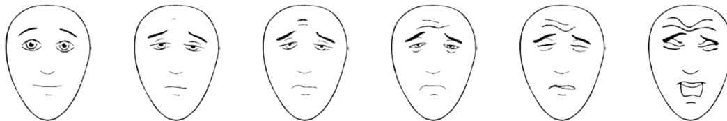
Échelle des visages pour évaluer la douleur – révisée, ©2001, l'International Association for the Study of Pain

Ces visages montrent combien on peut avoir mal. Ce visage (montrer celui de gauche) montre quelqu'un qui n'a pas mal du tout. Ces visages (les montrer un à un de gauche à droite) montrent quelqu'un qui a de plus en plus mal, jusqu'à celui-ci (montrer celui de droite), qui montre quelqu'un qui a très très mal. Montre-moi le visage qui montre combien tu as mal en ce moment.